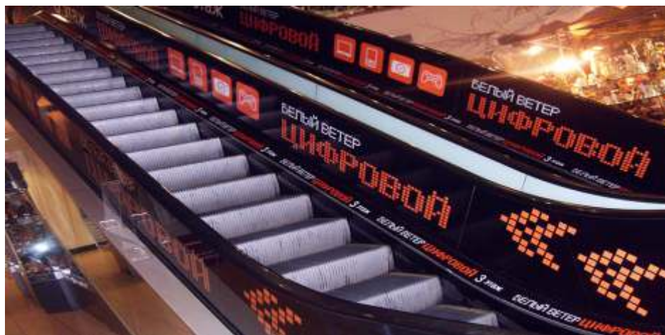
Брендинг ступеней и эскалаторов